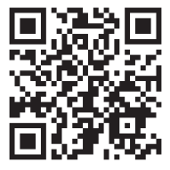
環境ビジョン(案)へのご意見募集ページ

コープ自然派奈良では、環境問題を生協の理念に関わるものと位置づけ、これまで取り組んできた国産オーガニック・有機農業推進の取り組みに加え、生協の事業・活動における環境負荷低減を目指し、コープ自然派奈良の環境ビジョンを策定予定です。 2024年4月から環境ビジョンPJを立ち上げ、7・8月に組合員向けのアンケートを実施、10月にアンケート結果を報告しました。その上で、コープ自然派奈良の環境ビジョン(案)を作成しました。添付QRコードからHPで内容をご覧いただけます。ご意見などございましたら、HP内のフォームからお送りください。〓切3/25(火)