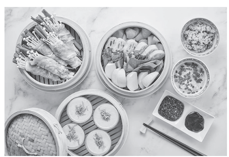
メニュー：有機野菜の蒸籠せいろ蒸し/自然豚の肉巻き/茶碗蒸し・中華スープ/黒もち米入りご飯。